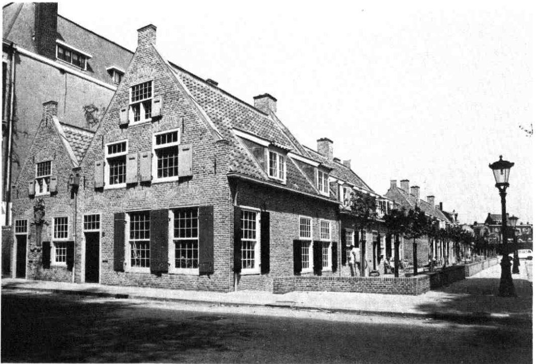
Afb. 3: De Breijerskameren na de restauratie, 1978.

en het voegwerk uitgehakt en opnieuw ingevoegd. Na het ontpleisteren van de zuidwestgevel, waarbij de gedenkplaat tijdelijk is weggenomen, werden metselde bogen gevonden. Deze bogen hebben als ontlastingsbogen boven de vensters gefungeerd.