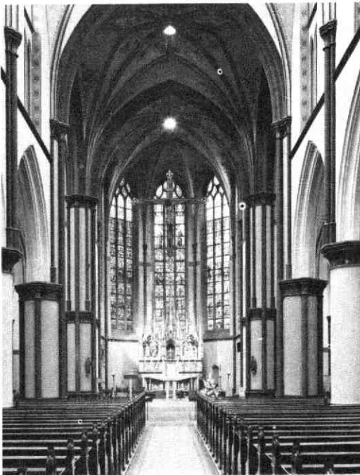
De St. Martinuskerk, gezicht op het priesterkoor. September 1972.

Het „Kottesyndroom” waarover in het artikel van 1972 sprake was, is in het koopcontract ondervangen: zonder verlof van het aartsbisdom mag de kerk niet voor godsdienstige doeleinden worden gebruikt. Wat eerder met de Willibrorduskerk gebeurde, is hier onmogelijk.