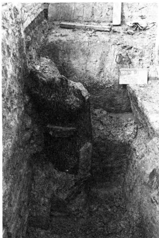
Put D op het Vredenburg, waarin in september 1976 de schaak-toren is gevonden

(met toestemming van auteur en redactie overgenomen uit De Timmerwerf, personeelsorgaan Dienst Openbare Werken Utrecht, jg. 30 (1976) nr. 5).