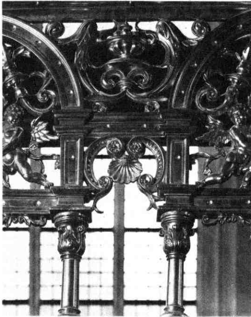
Gedeelte van het koorhek met engelfiguurtjes en schelp.