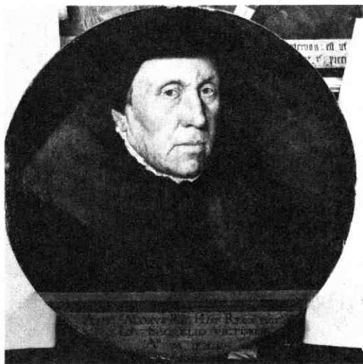
Portret van Jan van Scorel door Anthonie Mor; Society of Antiquaries, Londen

Jan van Scorel is een van de belangrijkste kunstenaars, die in het Utrechtse verleden een rol hebben gespeeld. Hij was in zijn eigen tijd (1495 - 1562) al zo beroemd dat de 16de eeuwse Italiaanse schrijver van kunstenaarsbiografieën Vasari hem in zijn boek opnam; ook in „Het Schilderboek“ van Carel van Man-