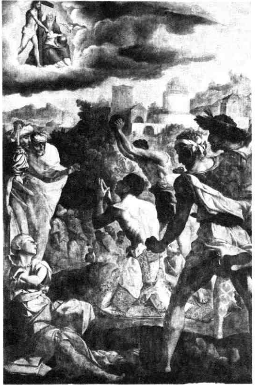
Middenpaneel van het altaar uit Douai: de Steniging van Stefanus