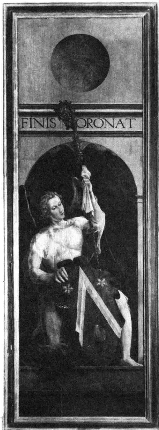
Luik van het altaar van Marchiennes; Musée de la Chartreuse, Douai