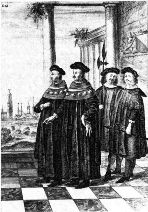
De raadsburgemeester en de schepenburgemeester in de ceremoniële dracht: rode „kovels” of mantelkappen met zilveren bellen. De raad nam de besluiten in strafprocessen maar de schepenen moesten doodstraffen uitspreken. Achter de heren twee stadsdienaars. Uit: Antonius Matthaëus, De Nobilitate , Amsterdam 1686, p. 1132.