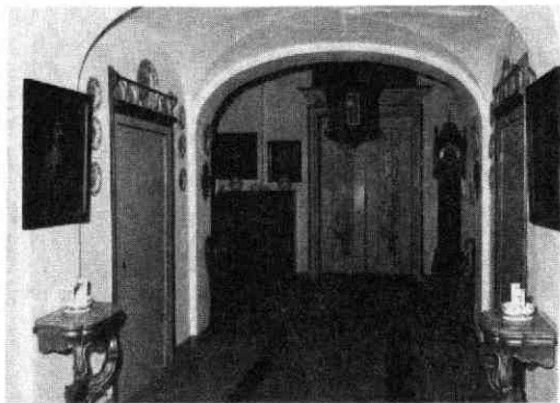
Toegang tot de grote zaal.