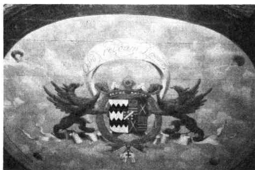
Plafond van de voorhal met de wapens Van Reede-Turnor en Heerlijkheid Amerongen