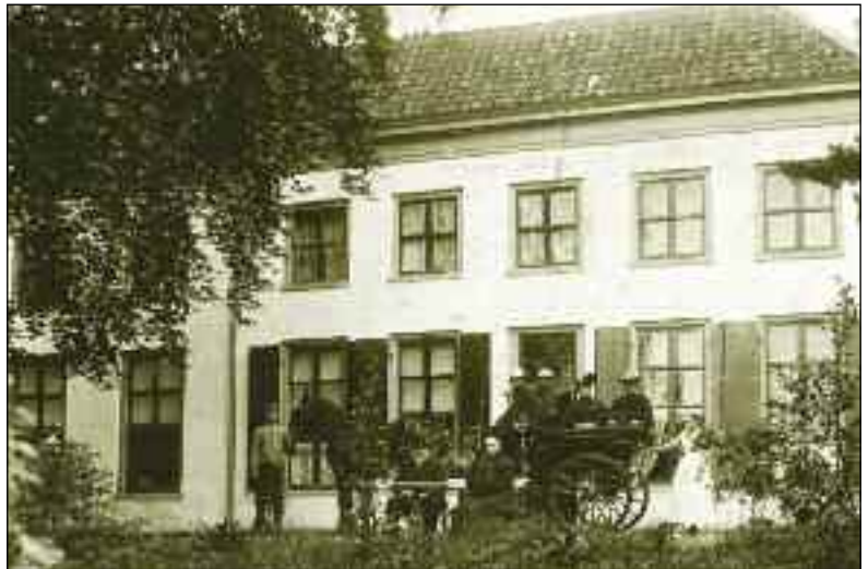
Boven: Het hoofdgebouw van Berg en Dal rond 1908, gezien vanaf het noorden. Vanaf deze plek had men een direct uitzicht op de Eem.

Deze Charles Nepveu behoort tot de categorie van belangrijke, maar vergeten persoonlijkheden uit de negentiende eeuw. Als militair dient hij onder een keizer en vier koningen. Hij vecht mee met Napoleon in Rusland, strijdt tegen Napoleon bij Waterloo en leidt een Nederlands detachement in Brussel tegen de opstandige Belgen. Als vertrouweling van de Oranjes, schopte hij het tot chef van de generale staf van het leger, wordt minister van Oorlog en verricht tussendoor belangrijke diplomatieke klussen. Als een van de weinige medestanders van de tamelijk ongeliefde Koning Willem III wordt hij zelfs in de