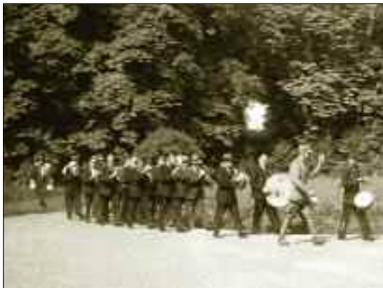
Boven: Limonade en cake in de tuin van De Heiligenberg. 1938. Links: Harmonie Lisiduna was marcherend vanaf De Mof naar De Heiligenberg gekomen om de burgemeester een muzikale groet te brengen. Boven het korps is het gat in de bomenrij zichtbaar dat zicht gaf op de Onze-Lieve-Vrouwetoren.