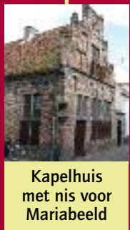
Kapelhuis met nis voor Mariabeeld