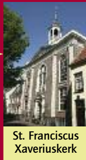
St. Franciscus Xaveriuskerk