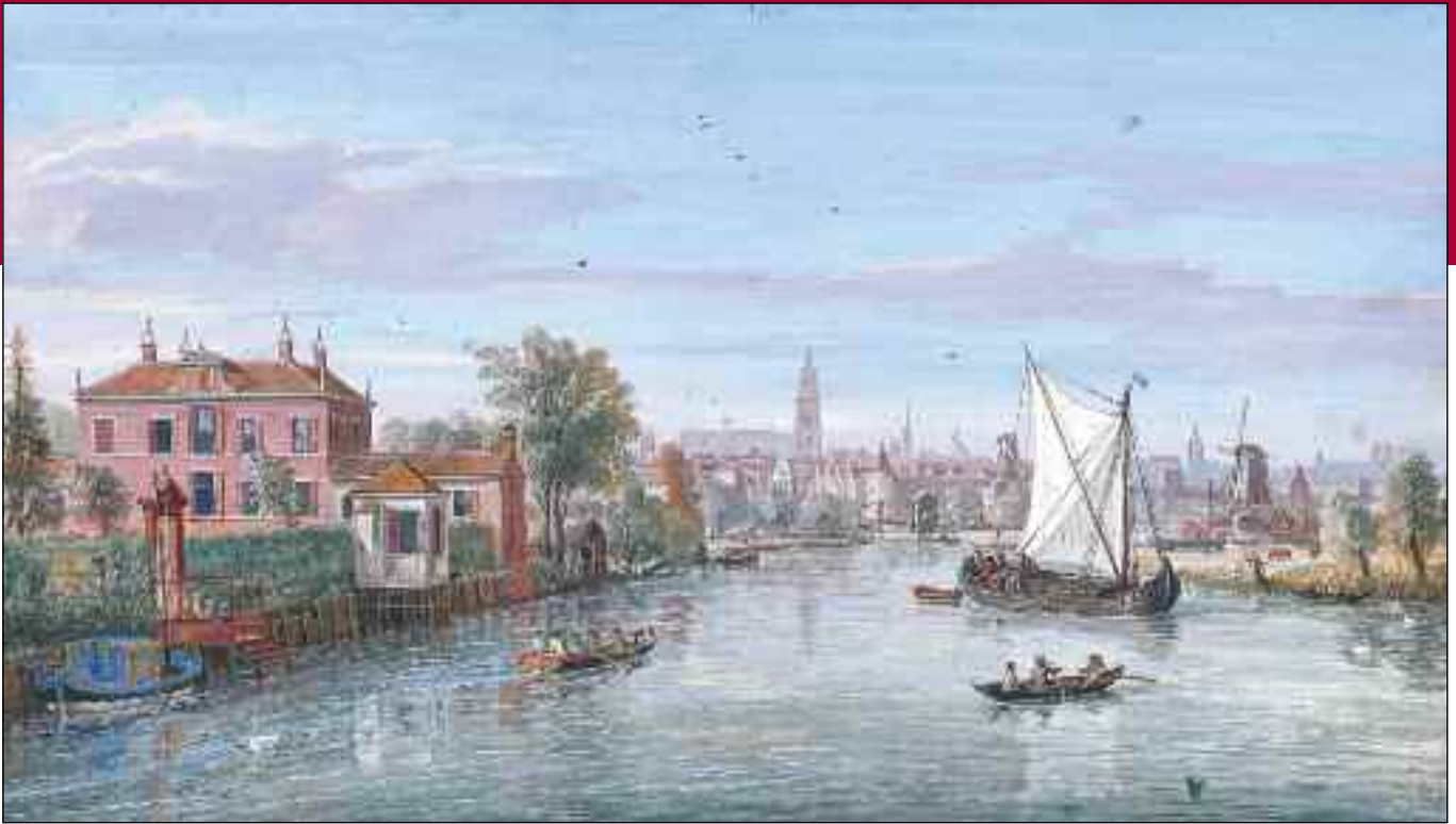
De gouache van Bonhams.

maten voor het indrukwekkende schilderij dat in 1671 door de stad werd aangekocht, als ciraat voor de raadszaal van het stadhuis dat in die tijd aan de Hof stond. Tegenwoordig maakt het deel uit van de permanente expositie in Museum Flehite.