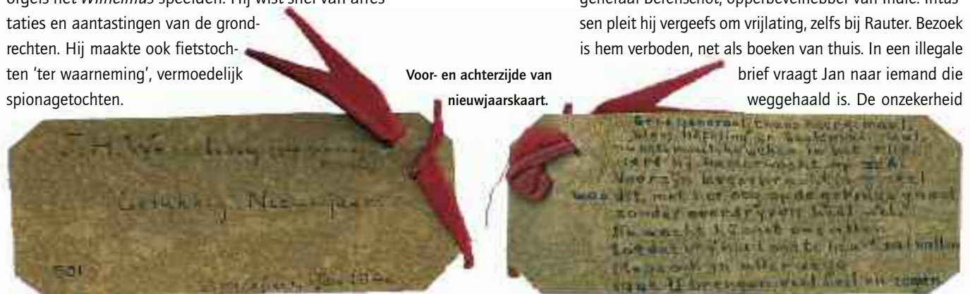
Voor- en achterzijde van nieuwjaarskaart.