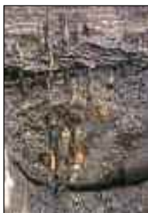
Omslagfoto: Muur met palen en vlechtwerk.

Onder de muur bevond zich een pakket van ruim een halve meter dik, liggend hout. Dunne stammen in een zandpakket, die kunnen hebben gediend als basis van de muur, een slietenfundering . Dit was in Amersfoort niet gebruikelijk, omdat men in de meeste gevallen het oorspronkelijke zand opzocht om muren een stevige ondergrond te geven. Hier echter bevindt zich het zand enkele meters dieper. Deze slietenfundering was blijkbaar nog niet voldoende, want hieronder stonden rijen dikke palen, die minstens een tot twee meter de grond