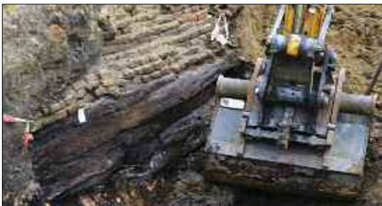
Scheepshout gebruikt als beschoeiing.

Wat zou het dan wél geweest zijn? Nieuwe theorieën over de mogelijke functie van de muur werden gevormd. Het was geen kapel, maar ook geen huis of groot gebouw. Zo kwam de gedachte op dat het misschien de muur was die de immunitet van de Sint-Joriskerk omsloot (geschonken door de bisschop van Utrecht in 1317, zie hierover de Kroniek van maart 2009, p. 26). Voor de hand liggend, omdat dit eigendom zich aan deze zijde van de kerk bevond: globaal in het gebied Groenmarkt, Papehofstede en Appelmarkt. Kijken we op de kaart van Braun en Hogenberg uit 1588, die overigens op veel plekken, maar niet overal de juiste situatie weergeeft. Dan zien we ter plaatse van de Appelmarkt enkele huizen en een muur die het gebied van de huidige Appelmarkt omsluit. Voor de tweede gebruiksfase van de muur – deze is namelijk in een latere periode opnieuw gebruikt – was die interpretatie er al. Maar misschien was de muur in de oorspronkelijke fase ook al de omsluiting van het kerkelijk gebied. Voor een immuniteitsmuur is deze zeer zwaar: breed en met steunberen op korte afstand van elkaar. Zeker toen het archeo-