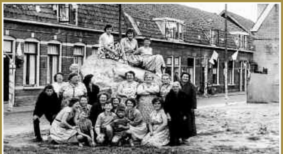
Oorspronkelijk bijschrift: 'Bewoners van de Walikerstraat hebben vrijdagochtend de Kei, die men de vorige week geplaatst had op de Varkensmarkt, weggehaald en versleept naar de Walikerstraat. Daar werd het brok graniet met grote vreugde ontvangen en "ingenomen" door het vrouwelijk deel van de straat.' 7 augustus.

Wie zichzelf of een ander herkent op een van de foto's of er aanvullende informatie over heeft, wordt vriendelijk verzocht contact op te nemen met Agnes Witte: a.witte@amersfoort.nl .