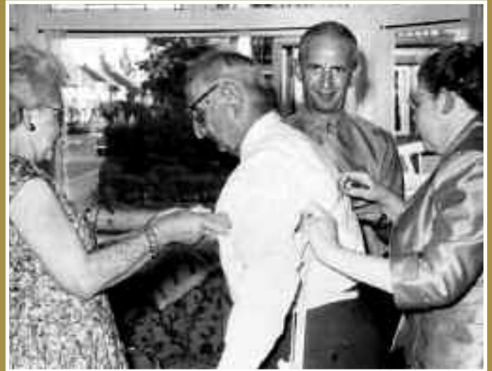
Een heer wordt de maat genomen voor zijn eeuwfeestkostuum.