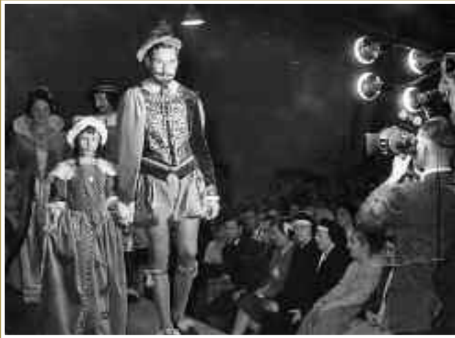
Show van historische kostuums in de Markthal: 'Een groepje Spaanse edelen. [...] Duizend Amersfoorters genoten van voorproefje.'