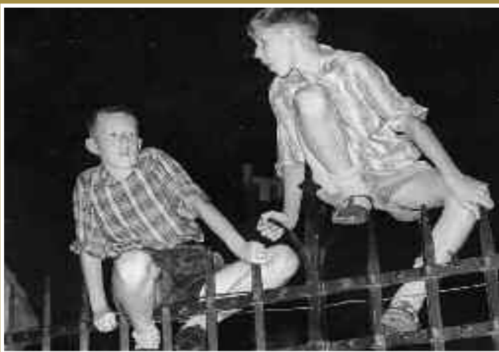
Twee jonge toeschouwers bij een historisch wagenspel op het Lieve-Vrouwekerkhof. Ze zitten bovenop het hek dat zich toen rondom de Onze-Lieve-Vrouwetoren bevond.