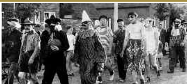
Oorspronkelijk bijschrift: 'De Middenstand Vereniging Leusderkwartier begon haar aktie met een gekostumeerde voetbalwedstrijd op het terrein aan de Scheltemalaan. Deze wedstrijd trok zeer veel publiek, dat zich kostelijk geamuseerd heeft. Hier ziet men de spelers op weg naar de "kampplaats".'