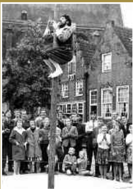
Mastklimwedstrijd op de Appelmarkt.