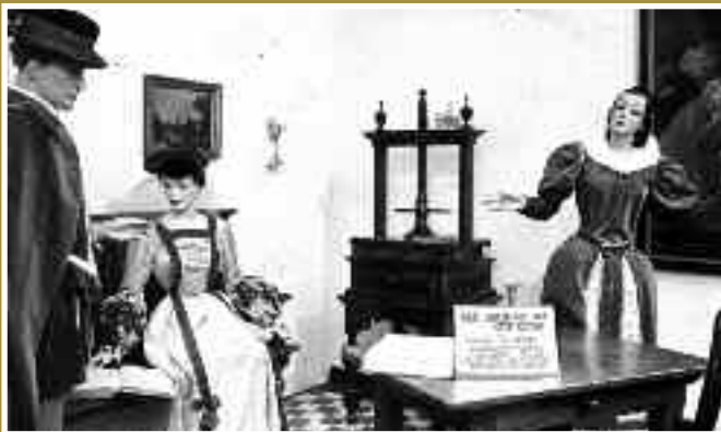
Sommige voorwerpen komen uit Museum Flehite, maar waar is deze foto genomen?