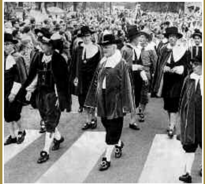
Optocht over de pas aangelegde Rondweg (later Stadsring).