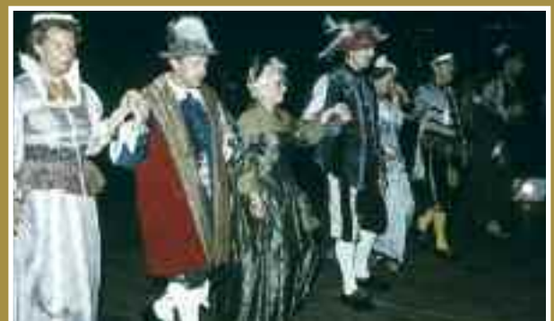
Gasten op een gekostumeerd bal in Mariënhof. Ze waren zo vriendelijk om af en toe langs het tuinhek te wandelen, zodat de mensen op straat konden meegenieten van het schouwspel.