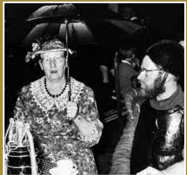
Tuinfeest in Mariënhof. Toch nog een buitje.