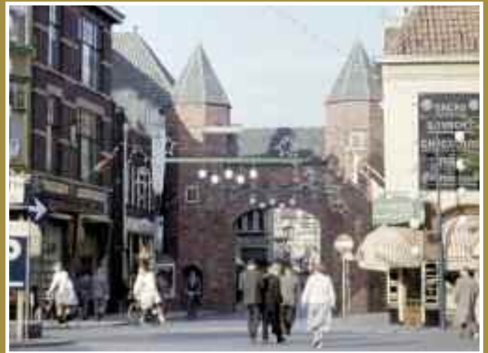
De door Dick Meester nagemaakte Rode torenpoort aan het begin van de Langestraat, bij de Varkensmarkt.