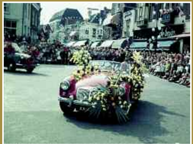
Het afsluitende bloemencorso, 15 augustus.

Nog veel meer foto's van de eeuweesten van 1959 zijn te vinden op de website van Archief Eemland: www.archiefemland.nl /beeldbank/Specifiek zoeken/Amersfoort/Gebeurtenis = Eeuweesten 1959