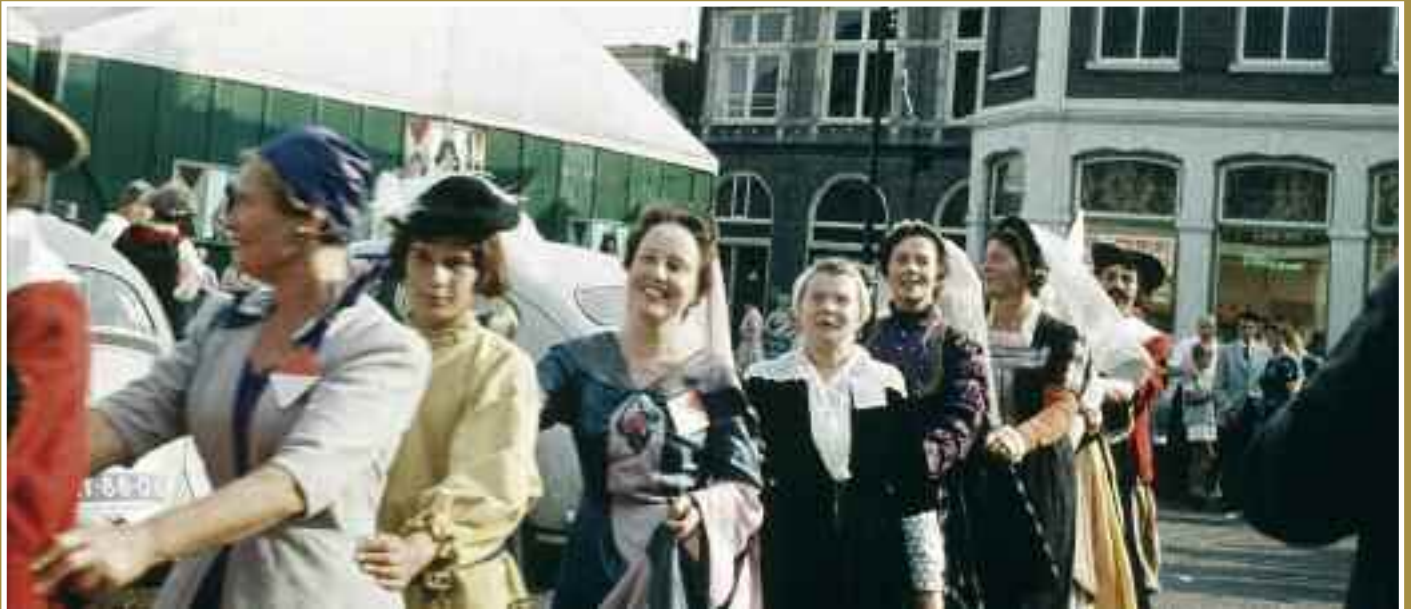
Polonaise dansen op de Hof. Op het plein is een grote tent opgezet, de zogenaamde 'Beierse Hof'.