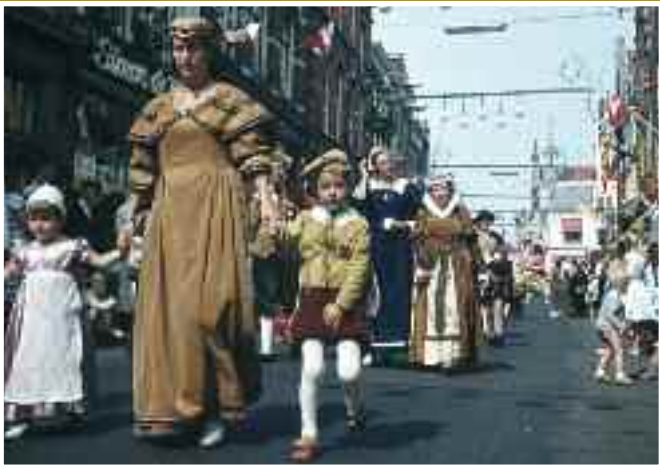
Op 1 augustus werd het aantal deelnemers aan de optocht geraamd op 3000. Langestraat; links de kruidenierswinkel van Simon de Wit.