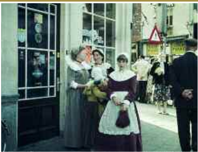
Een groepje op de Varkensmarkt; achter hen toeschouwers bij een optocht.