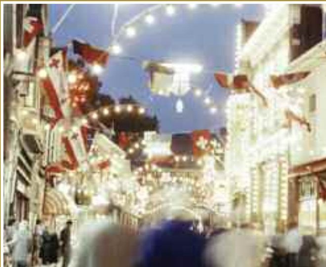
Feestverlichting in de Arnhemsestraat.