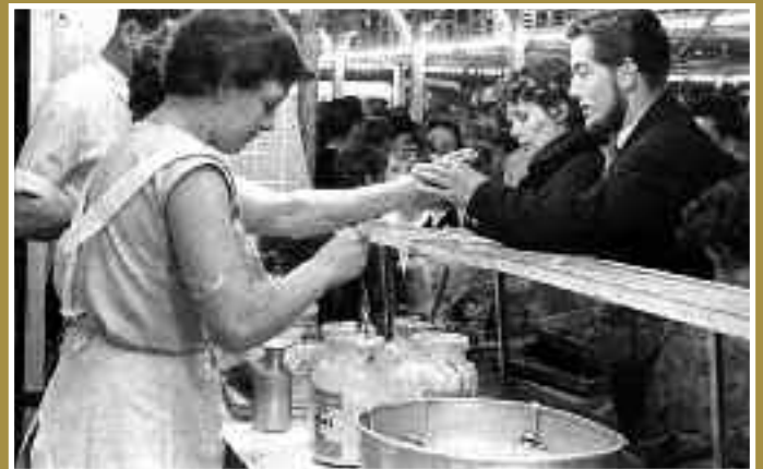
Patates-fritesverkoop op de eeuwfeestkermis aan de Rondweg (later Stadsring).