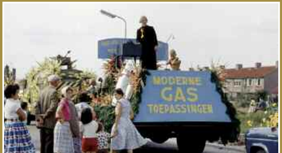
Versierde wagen van het gemeentelijk Gasbedrijf, in het afsluitende bloemencorso, 15 augustus.