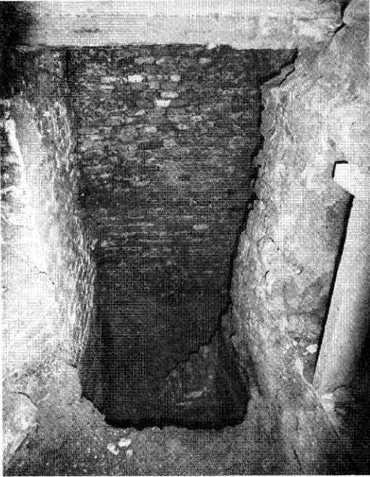
Abb. 2. Muurdeel haaks op de voorgevel van het brouwhuis.

Op de tweede foto een afbeelding van een muurdeel haaks op de voorgevel van het brouwhuis die zich rechts bevindt. Enigszins zorgvuldig afgebroken lijkt de voor de hand liggende conclusie. Evenwel, een gesloopte muur laat sporen in de grond achter en in het profiel tegenover het uiteinde van het muurfragment is niets te zien wat op een uitbraaksleuf lijkt: de grond is ongestoord. Men zal