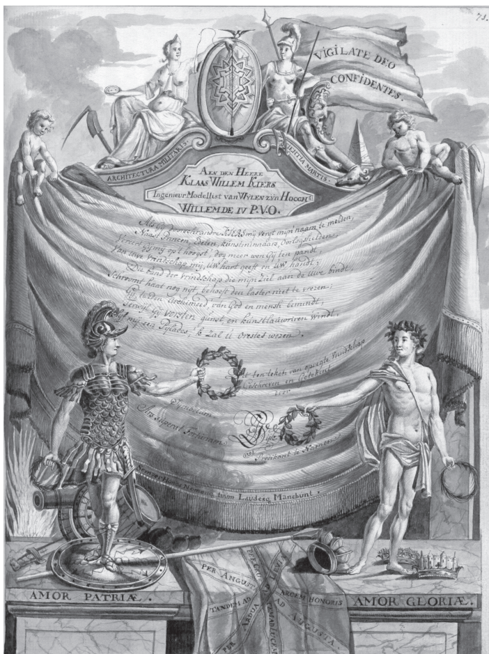
Fig. 3: Inscriptie en illustratie van J. van Dijk in het Album van Kiers.

een gedicht waarin hij Kiers adviseert niet te driftig het aardse goed na te jagen. Uit Kiers' werkzaamheden na uitdiensttreding zou blijken hoezeer de kolonel het bij het rechte eind had toen hij zijn bijdrage besloot met: