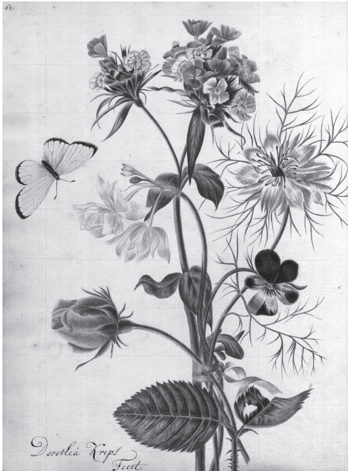
Fig. 1: Niet eerder gesignaleerde gouache van de vrouwelijke schilderes Dorothea Kreps in het Album van Kiers. (UB Groningen)

en landmeetkunde, naast andere technische vakken werd onderwezen. 64 Juist in deze tijd worden hier plannen gemaakt voor de aanleg van een omvangrijk instrumenten- en modelkabinet. 65 Dat Kiers hier contact zoekt, ligt dus voor de hand.