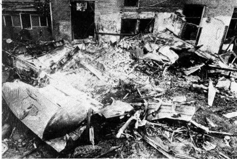
Een overzicht van de ravage achter Bouwstraat 37. Links op de voorgrond een stuk van de rechter vleugel met de binnenste motorgondel. Geheel rechts is nog een propellerblad te zien. (GA Utrecht, HA V 43.34).

toen immers 's nachts niet op straat komen - naar de getroffen wijk. Daar zag hij de vele wrakstukken en uitgebrande huizen en hoorde hij ook veel verhalen. Er was een gezin, bestaande uit vader, moeder en een zoon omgekomen, en een andere familie had een jong kind verloren. Vijf Engelsen waren op verschillende plaatsen dood gevonden; een was zelfs door een dak geslagen en in een slaapkamer dood op een bed gevonden. Een paar bemanningsleden zouden het er, hoewel gewond, met hun parachutes levend afgebracht hebben maar door de Duitsers gevangen genomen zijn. Hoe het allemaal werkelijk in elkaar zat was toen echter moeilijk te achterhalen. Maar de herinnering liet hem niet los; telkens weer vroeg hij zich af, wat het voor een vliegtuig geweest was, wie erin gezeten hadden, welke bewoners waren omgekomen, en zo meer.