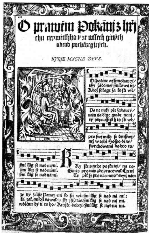
Bladzijde uit een gezangboek van de Oude Tsjechische Broeder-Uniteit, Ivanceice 1576 (cat. nr. 7).

Inlichtingen over openingstijden en sluitingsdatum verstrekt mev. E. de Leeuw-Mielard, Marius Bauerstraat 30, Woerden, telefoon 03480 - 44 60.