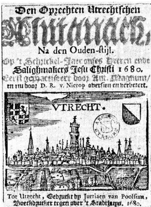
Titelblad van „Den oprechten Utrechtschen Almanach”, 1680.

Een archief is een „gegroeid” geheel van bescheiden die ambtshalve worden ontvangen of