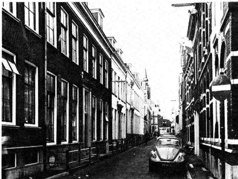
Brigittenstraat naar het westen met links de nrs. 7 t/m 1.

Zeer belangrijk voor de toekomst van het zuster-