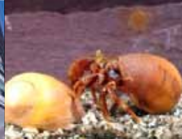
Pijnbeleving van krabben [p.9]