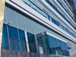
Fotoreportage: David de Wiedgebouw [p.6]