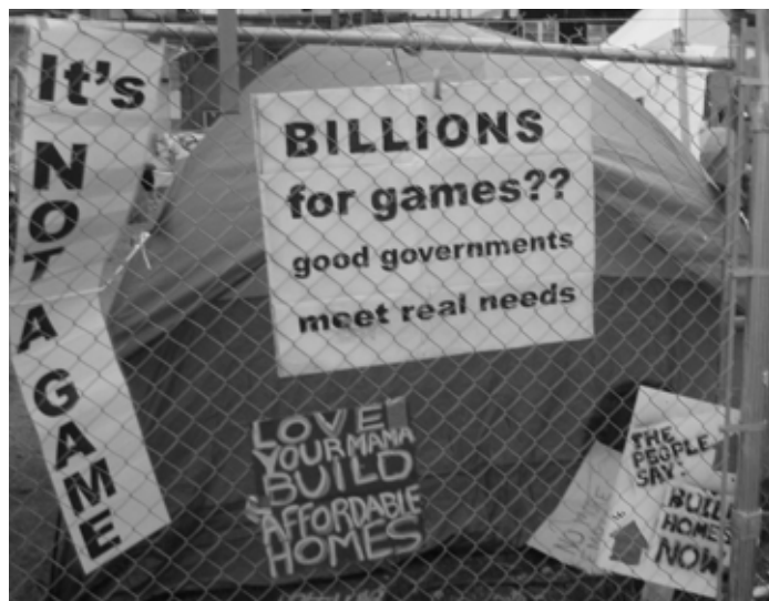
Protesten tijdens de Olympische Spelen van Vancouver in 2010