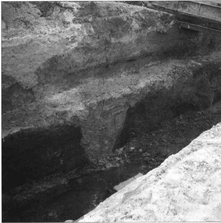
Doorgraving van de Meerndijk in 1993 ten behoeve van de aanleg van een veetunnel. Aan de westzijde van de Meerndijk (thans de provincialeweg De Meern - Montfoort etc.) is in het profiel de voormalige sloot tussen het vroegere vrijliggende zandvoetpad en de oude weg te herkennen.

gelijke omstandigheden riepen dijkgraaf en heemraden van de Meerndijk de onderhoudsplichtigen op om de bedreigde plaatsen op te hogen.