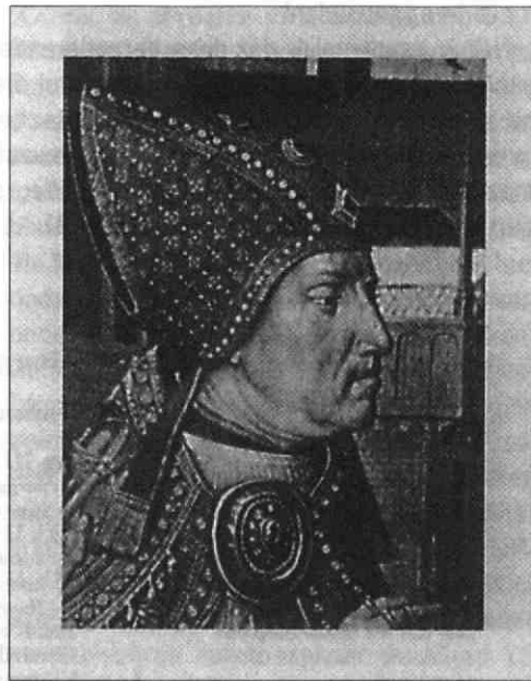
Afb. 3. Bisschop David van Bourgondië, ca. 1480

Deze Reinoud II van Brederode was behalve heer van Vianen en Ameide ook leenheer van het Ronde Dorp van Breukelen en diverse andere goederen in en nabij het dorp