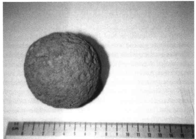
Katapultkogel. Basaltlava (tefriet) vermoedelijk Romeins.

Vanzelfsprekend was er onderling contact en uitwisseling van goederen. Op deze wijze zou ook de Romeinse slingersteen op het terrein van Hismade terecht kunnen zijn gekomen. Ook is het mogelijk, dat de steen in de loop der tijden in het Romeinse gebied is gevonden en werd meegenomen naar Hismade en daar weer is verloren. In het Romeinse leger waren slingeraars en steenwerpers. Om hun actie te vergroten werden werpmachines uitgevonden. De Romeinse architect Vitruvius, die leefde in de eerste eeuw vChr, schrijft op late leeftijd over de tijd van keizer Augustus (63 vChr - 14 nChr), en geeft beschrijvingen en werktekeningen voor de bouw van Catapultae (werpmachines), Scorpiones (werptuigen tot het werpen van spitse stenen, pijlen enz.) en Ballistae (slinger-werptuigen) om speren en stenen te werpen.