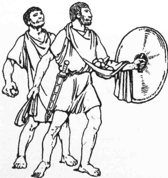
Slingeraar en Steenwerper