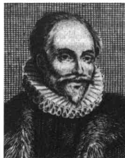
Arminius Jacob Harmenszoon (1560 - 1609)

Nederlandse Geloofsbelijdenis te herzien waartegen zij grote bezwaren hadden. Vanaf dat moment werden de Arminianen bestempeld als Remonstranten. In 1614 dienden de gomaristen een contraremonstrantie in waarin zij het verzoek deden tot het bijeenroepen van een nationale synode om uit te maken wie