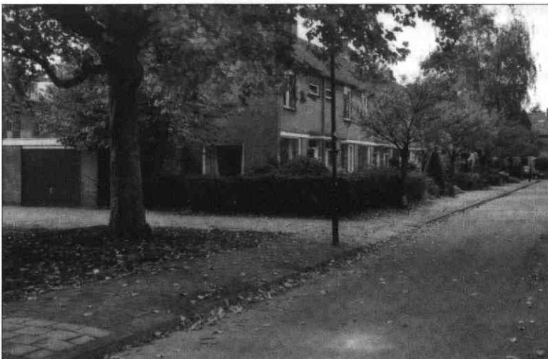
Piet Heinstraat vanuit het oosten

Pieter Pieterszoon Heyn, ook wel geschreven als Hein, is de oudste zeeheld in onze vaderlandse geschiedenis. Hij is op 15 november 1577 in Delfshaven geboren. Hij was een vlootvoogd die eerst werkzaam was bij de Oost-Indische Compagnie. Vervolgens trad hij in 1623 als vice-