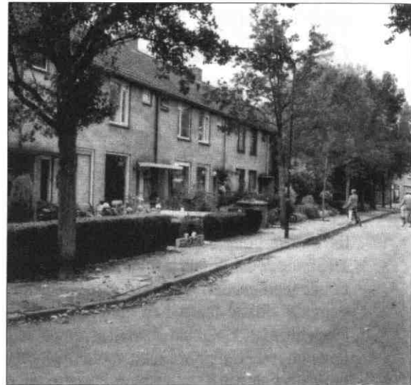
De Ruijterstraat vanuit het oosten

Tijdens een slag bij Syracuse raakte hij op 22 juli 1676 zwaar gewond en overleed een week later. Zijn stoffelijk overschot werd met veel ceremonieel bijgezet in de Nieuwe Kerk in Amsterdam. Zijn tombe is in opdracht van de Staten-Generaal gemaakt door Rombout Verhulst.