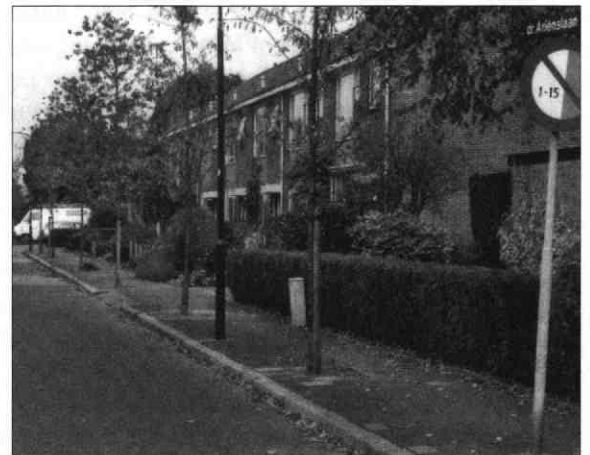
Dr. Ariënslaan vanuit het zuiden

De gemeenteraad stelde op 20 december 1963 zijn straatnaam vast 6 .