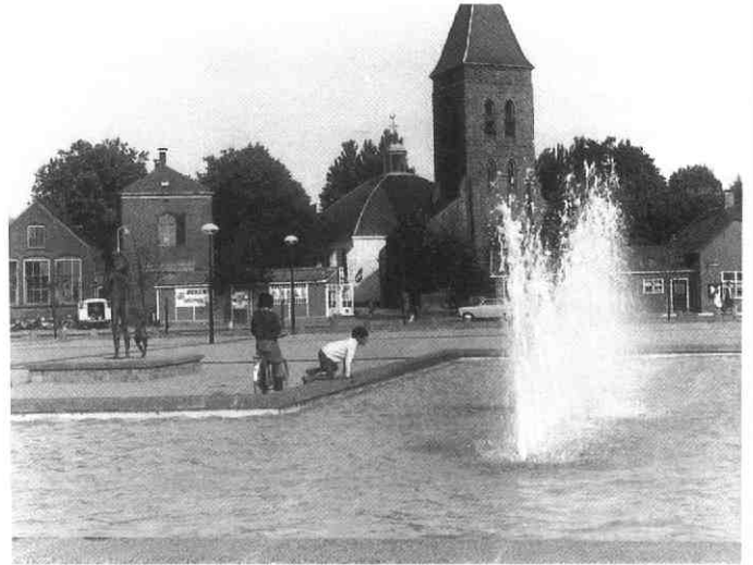
Dorpsplein met torenplein en N.H.Kerk in 1971.