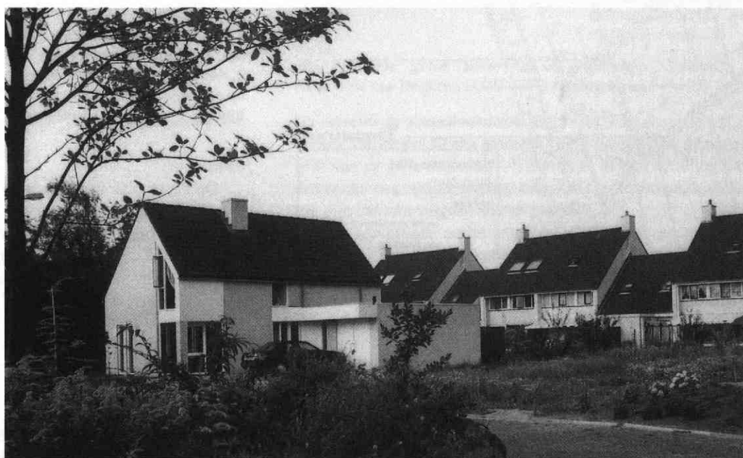
Achterkant van de Loswal gezien vanaf het Haarpad.