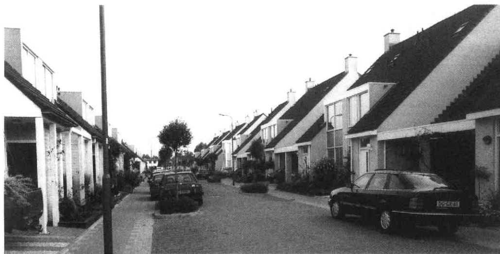
Houtwerf gezien vanuit het zuidwesten in 1992.