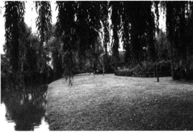
Rijnbedding vanuit het westen in 1991

Rijn of Vleutense wetering genoemd. De naam Vleutense wetering was in 1663 al bekend.