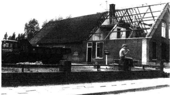
De afbraak van hofstede Odenvelt