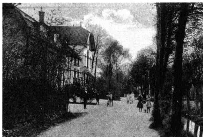
Stationsstraat omstreeks 1910

Als herinnering aan hofstede Odenvelt uit het begin van de 19e eeuw en de daarna in 1967 gebouwde wijk is de Odenveltlaan en het Odenveltpark genoemd. Het gedeelte van de Odenveltlaan tussen de Dorpsstraat en de kruising van de Stationsstraat/Hamweg met de brug over de Vleutense Wetering is van Middeleeuwse oorsprong. Deze eeuwenoude oeververbinding tussen noord en zuid Vleuten verdween in 1970 en werd vervangen door een duiker. Dit deel van de Odenveltlaan was daarvoor een deel van de vroegere Stationsweg dat in 1925 Stationsstraat werd genoemd. Dit deel van de straat en de nieuw aangelegde weg is in 1970 door de gemeenteraad Odenveltlaan genoemd. Nadat de laatste fruitboomgaard in Odenvelt in 1971 was gerooid, kon met de aanleg van het Odenveltpark worden begonnen. In de raadsvergadering van 2 februari 1971 is de naam Odenveltpark officieel vastgesteld.