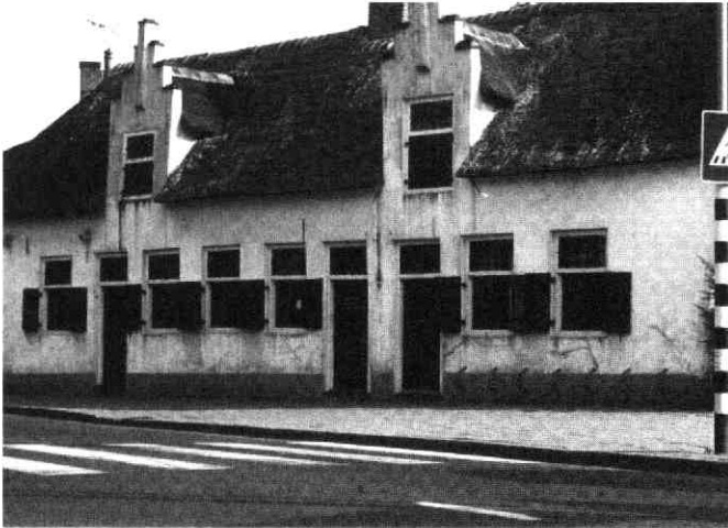
Huisjes van de Broederschap waarnaar de laan genoemd is. In deze huisjes is de Historische Vereniging Vleuten, De Meern, Haarzuilens gevestigd.

Uit het raadsbesluit kan niet opgemaakt worden of deze straat is genoemd naar het geslacht Uten Ham of naar jonkvrouw Elisabeth. Het laatste ligt voor de hand omdat de daarnaast liggende straat van Wanroystraat is genoemd.