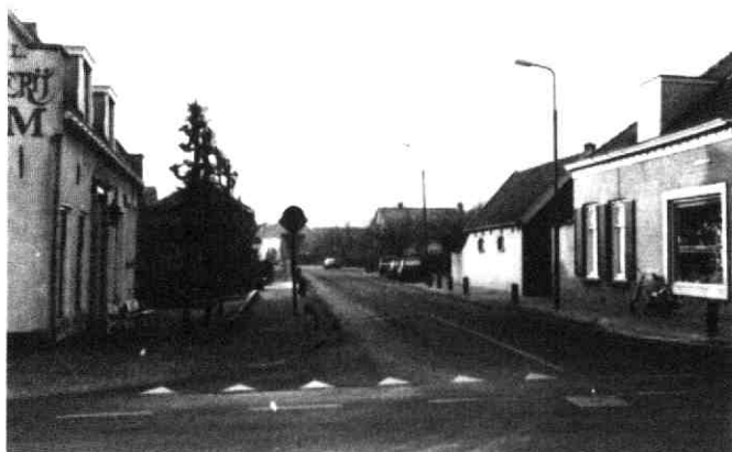
Odenveltlaan hoek Dorpsstraat in 1999

In Odenvelt/Noord bestonden al enkele straatnamen waarover in de raadsbesluiten niets te vinden is. Het ging om de Utenham-, Van Wanroy-, Van Woerden- en Bernard van Hamstraat. Sommige leden van de gemeenteraad vroegen zich af waarom in Odenvelt geen vervolg werd gegeven aan de voortzetting van de historische straatnamen. Er waren na de genoemde namen toch nog vele geslachten die Den Ham hebben