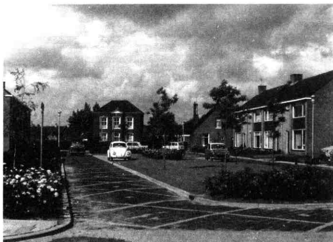
Utenhamstraat vanuit Den Hamstraat