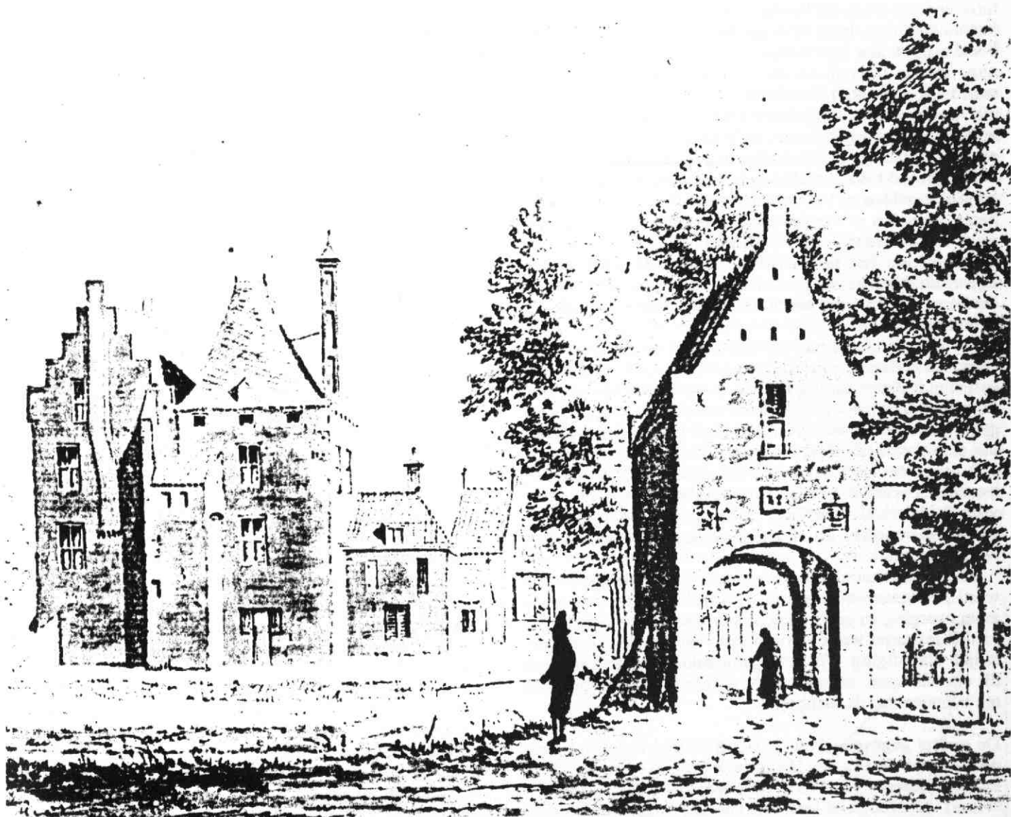
Utrecht, Top. Atlas nr. 1326

Napoléon, Keizer der Franschen, Koning van Italiën, Beschermer van het Rijnverbond, Bemiddelaar van het Zwitsersche Bondgenootschap enz. enz. enz. Aan allen dien zulks zoude mogen aangaan. Heil! Zo wordt in 1813 de veiling aangekondigd van De Ridderhofstad Den Engh met ruim 40 ha. grond. Het is een omvangrijke en ingewikkelde akte, niet alleen omdat men zich wijdlopieg uitdrukt en in herhalingen vervalt, maar ook omdat men zich blijkbaar onder de Franse wetgeving niet erg zeker voelde over procedurele en juridische kwesties. Mede daarom zijn bij dit lijvige stuk ook nog een twintigtal verklaringen gevoegd, alles op zegel. Achteraf bleek er nog het één en ander aan te mankeren en werd dit in een langdradige verklaring aangevuld.