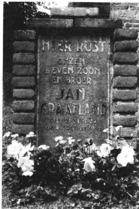
4. Foto van het graf van Jan Graafland op het kerkhof in Vleuten.

Tot zover de brieven en het dagboek van de zeer jonge Jan Graafland. De oorlog zou nog 7 maanden duren met daarin de hongerwinter.