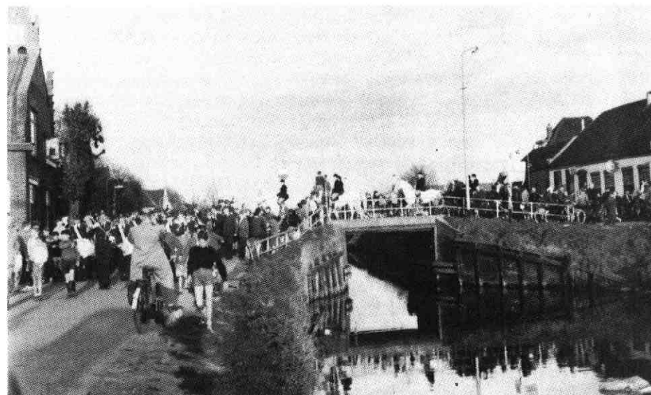
8. ... werd de route meerdere malen gereden.

de hulpverlening werd afgesproken dat hij zijn schuld in het volgende weekend zou komen voldoen. Als een doodeerlijke Rotterdammer gebeurde dat ook zo ... Maar met een Hagenaar, die ook betrokken was bij een ongeluk, was het adres in Den Haag dat de man achterliet bij controle achteraf een niet bestaand adres ... hi-hi-hi.