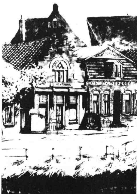
4. Café „De Meernbrug” van Van Straten

Bij eigen patiënten zag ik wel eens wat door de vingers ... Een zoon, wiens ouders patiënt waren bij mij, had te veel aan „Bacchus geofferd” en daardoor brokken veroorzaakt in Huis ter Heide. Met woorden van „hoe kun je dat je ouders aandoen”, deed ik toen „discreet” de deur maar achter hem dicht ... hi-hi-hi.