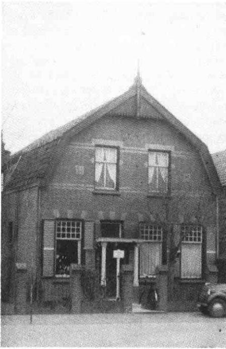
2. Het eerste doktershuis aan de Meerndijk

Utrecht vice-versa, zich over dit kruispunt. In de volksmond kreeg hij al gauw de bijnaam „Brokkendokter”.