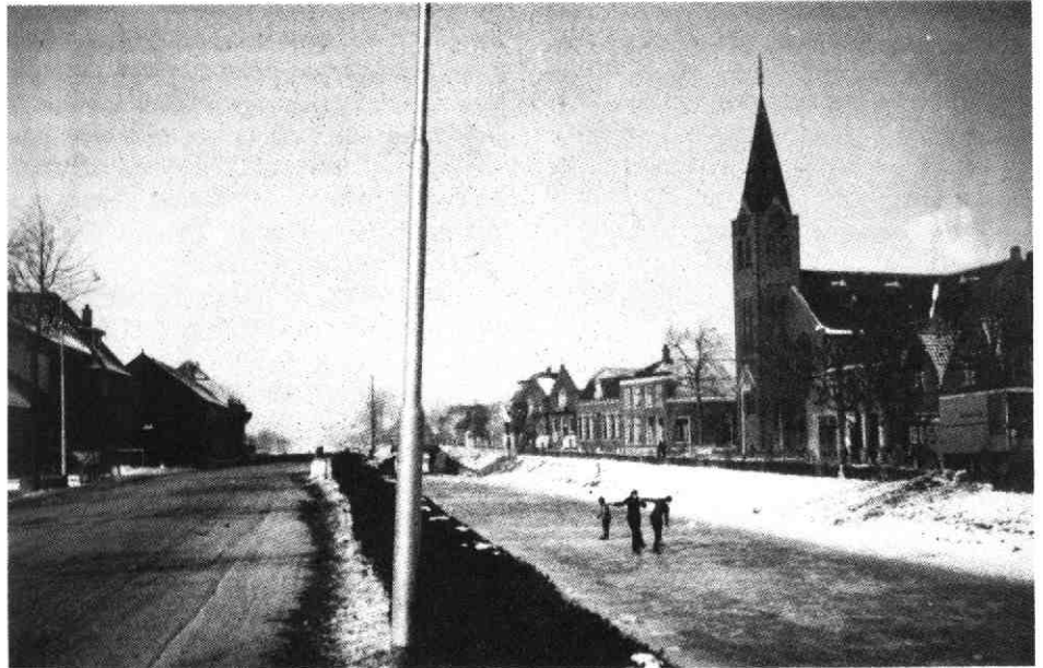
3. De Meern, als 'n kerstkaart in de sneeuw. Foto: jan. 1956

Het was op 'n 29e februari dat hij zich bij een oproep naar een bevalling spoedde. Bij aankomst waren de weeën verdwenen en dit herhaalde zich enige malen. Aan het eind van de dag heeft hij - toen het probleem zich weer voordeed - gedaan alsof hij wegging, de deur hard dichtgeslagen en buiten enige minuten gewacht. En ja hoor, de aanstaande vader maakte alweer aanstalten hem erbij te roepen ... „Door al deze vertraging werd het kind (net) op 1 maart geboren ... hi-hi-hi”.