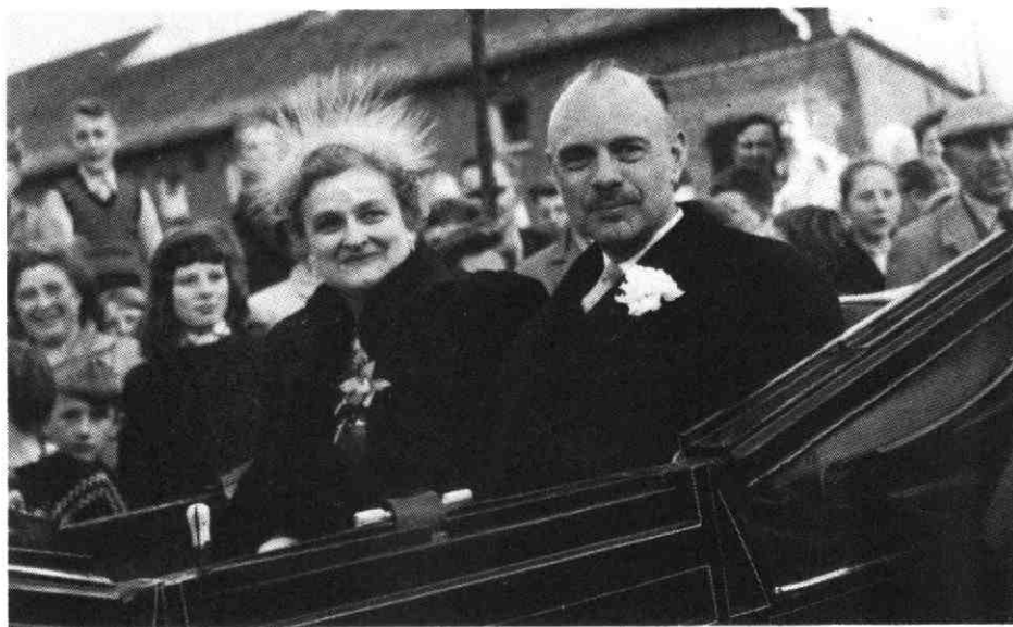
6. In een open calèche ... zorgde hij voor een volksoploop ... Foto 1959