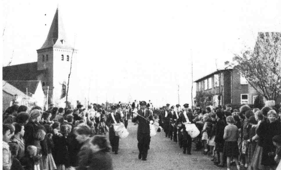
7. Voorafgegaan door het Meernse Muziekkorps ...