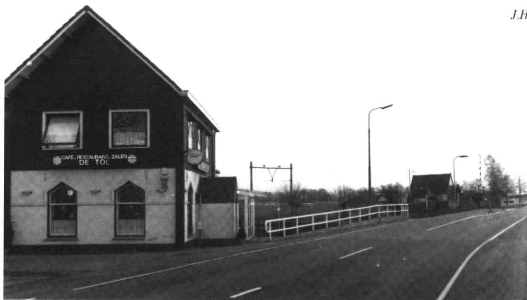
afb. 2 Van de oude tol is alleen het café-restaurant als herinnering overgebleven