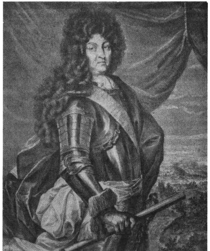
Lodewijk XIV (1638 - 1715)

Die kans leek gekomen toen in 1665 in Spanje de onmondige koning Karel II de troon besteeg. Lodewijk XIV maakte hiervan gebruik door namens zijn vrouw aanspraken te laten gelden op de Zuidelijke Nederlanden. De gelegenheid was gunstig, want Engeland en de Republiek bevochten elkaar op zee en konden zich dus moeilijk verzetten. Lodewijk liet een leger binnenvallen in het gebied.