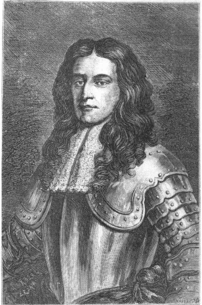
Willem III (1650 - 1702)

En zo ging het in eerste instantie ook. Ik wil niet te diep ingaan op het verloop van de veldtocht, omdat dan ons eigenlijke onderwerp teveel in het gedrang zou komen, maar enkele hoofdlijnen moet ik wel aangeven, al was 't alleen maar om te laten zien hoe kleinigheden en gemiste kansen