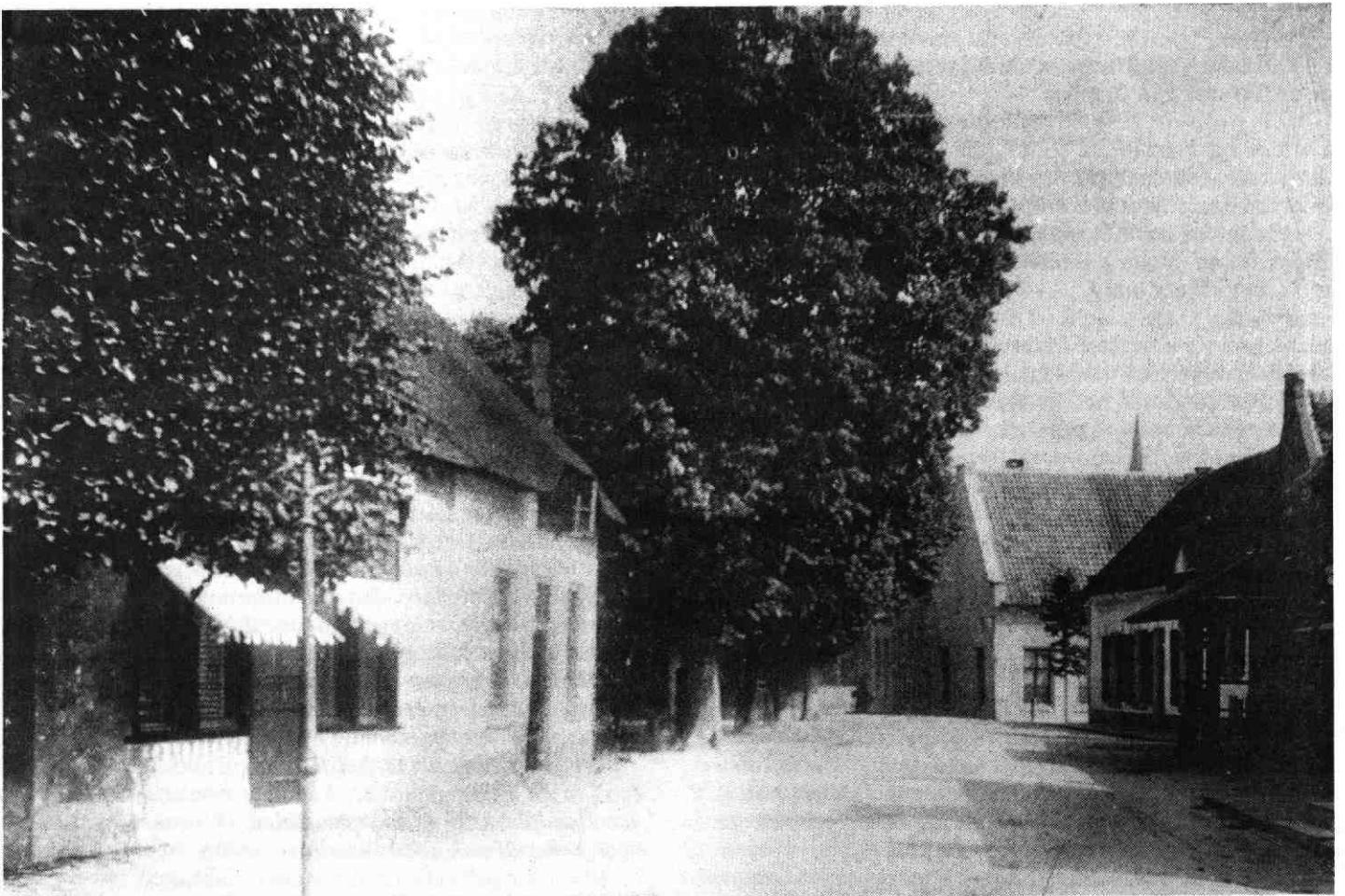
Foto vanuit het noordwesten. Links de Broederschapshuisjes, recht vooruit de Brouwerij en rechts respectievelijk de boerderij van de weduwe Van Dijk, de woning „bewoond door twee arme gezinnen” (met tuitgevel) en de smederij (met travaille). Foto van omstreeks 1895, eigendom van J.W. Schoonderwoerd te De Meern.