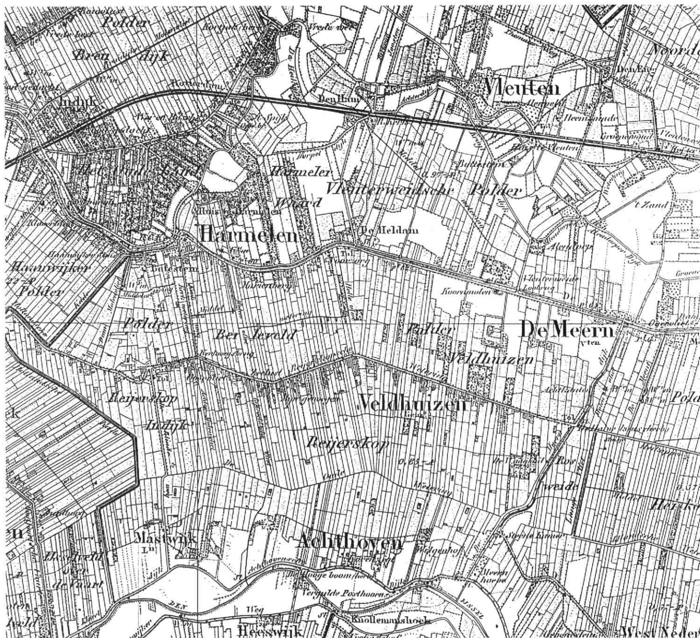
1. Gedeelte van de topografische kaart 1 : 50.000, blad 31 oost (Utrecht); toestand 1854, uitgave 1855. Ongeveer tweemaal vergroot. Het noorden is boven. De Meerndijk loopt vanaf De Meern in zuidwestelijke richting tot aan de noordelijke IJsseldijk bij Achthoven. Het grootwaterschap Bijleveld en de Meerndijk werd als volgt begrensd: in het oosten door de Meerndijk, in het zuiden door de Achthovensedijk en de noordelijke IJsseldijk, in het westen door de Hollandsekade (links op de Kaart), in het noorden door de Dorpeldijk en de straatweg tussen de Heldam en de Meerndijk. Bovendien behoorde de Bijleveld tot dit grootwaterschap; daarvan is slechts een klein gedeelte op de kaart te zien. Daarbinnen lagen de polders Bijleveld (hier Beileveld gespeld, Veldhuizen, Reijerskop (hier gesplitst in Reijerskop Indijk en Reijerskop), Mastwijk en Achthoven bezuiden de Leidse Rijn en de Harmelerwaard benoorden die watergang.

Ik zal nu overgaan tot het beschrijven van de resultaten van mijn eigen onderzoek naar de zegswijze „aan de Meern”, waarbij men zowel de Meerndijk als het dorp van die naam op het oog had. Er zal echter eerst een korte uiteenzetting worden gegeven over het voormalige grootwaterschap Bijleveld en de Meerndijk en de functie die de zogenaamde kameraar daarin vervulde. Het zijn namelijk de jaarlijkse rekeningen van deze ambtenaar die ik als bronnen heb gebruikt.