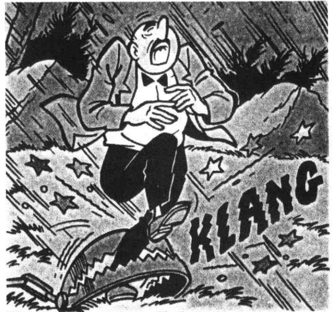
Willy Vandersteen, Suske en Wiske, De koddige kater. Standaard Uitgeverij Antwerpen - Amsterdam, 1976.

De heer Lenselink schrijft: In onze oudste gedrukte instructie-inventaris van de artillerie (uit 1871) was de term voetangel zelfs niet meer aanwezig; in de vestingen werd dit voorwerp dus kennelijk niet meer gebruikt.