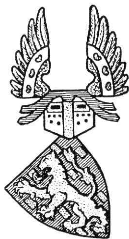
STAMWAPEN VAN NASSAU