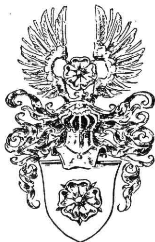
STAMWAPEN VAN LIPPE