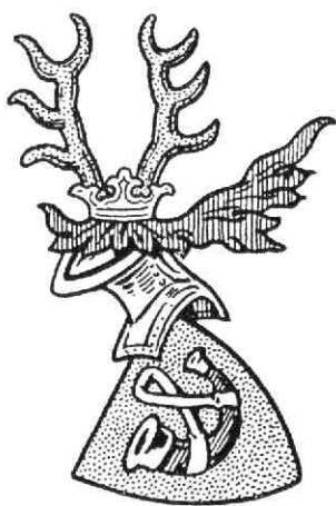
STAMWAPEN VAN ORANJE