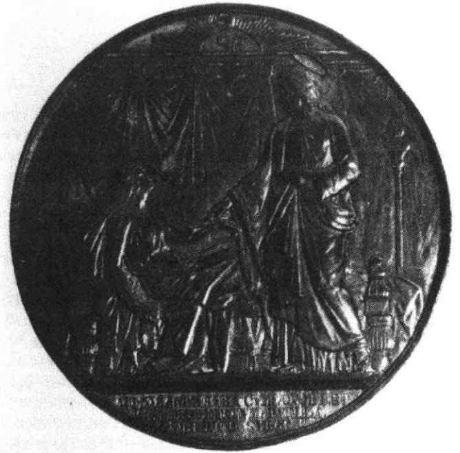
3. Penning ter gelegenheid van het herstel van de bisschoppelijke hiërarchie in 1853 met de voorstelling van de opwekking van de dochter van Jairus. Het ontwerp is van Leopold Wiener.

Op 4 maart 1853 verscheen van paus Pius IX de apostolische brief Ex qua die , waarmee de bisschoppelijke hiërarchie in ons land werd hersteld 4). In feite werd hierdoor de kerkelijke situatie gelegaliseerd die beneden de grote rivieren al jaren een feit was. Gelijktijdig werd het concordaat van 1827 opgeheven en had de vice-superior voor het noordelijk missiegebied, die inmiddels in Den Haag zetelde, geen functie meer. Al deze ontwikkelingen brachten een stormachtige gevoelsontlading bij de protestanten teweeg, die als de „Aprilbeweging” bekend is gebleven. Deze protestactie was zowel tegen het herstel van de bisschoppelijke hiërarchie als tegen de persoon van Thorbecke gericht. Het gevolg van dit alles was dat Thorbecke om ontslag als minister vroeg, hetgeen door koning Willem III werd ingewilligd.