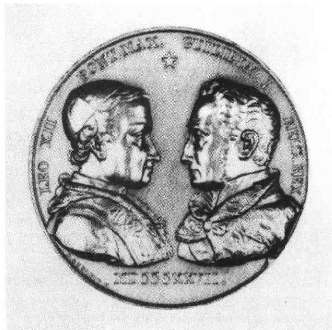
2. Penning in verband met het sluiten van het concordaat in 1827. De penning is ontworpen door F. de Hondt.

moesten volgens de koning twee bisdommen komen, namelijk in 's-Hertogenbosch en Amsterdam. Deze en andere ontwikkelingen resulteerden in september 1827 in een concordaat tussen de Nederlandse regering en het Vaticaan. Ter gelegenheid daarvan werd zelfs een herdenkingspenning uitgegeven (zie afb. 2).