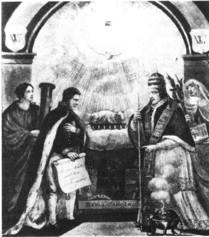
1. Zinnebeeldige voorstelling van het concordaat tussen koning Willem I en paus Leo XII in 1827. Onder het alziend oog met daaronder de duif en het Lam op de zeven zegelen, staan de koning en de paus. De twee vrouwenfiguren symboliseren de standvastigheid (links) en het geloof (rechts).

In 1840 deed Willem I afstand van de troon en vestigde hij zich in Berlijn, waar hij in 1841 trouwde met de katholieke Belgische gravin Henriëtte d'Oultremont. Hij werd opgevolgd door zijn zoon Willem II, die sympathieker ten opzichte van de katholieken stond. Dit kwam mede door zijn vriendschap met de Tilburgse pastoor Joannes Zwijsen, die veel invloed op hem uitoefende en hem ook adviseerde. Toen bekend werd dat koning Willem II het concordaat van 1827 wilde uitvoeren, kwam het in ons land tot anti-katholieke rellen; daarop krabbelde de koning terug. In Rome wilde men echter dat het concordaat uitgevoerd zou worden en in 1842 werden drie apostolische vicarissen benoemd voor Breda, 's-Hertogenbosch en Roermond 3). Joannes Zwijsen werd coadjutor van de apostolisch vicaris van 's-Hertogenbosch; later zou hij meer voor het voetlicht treden.