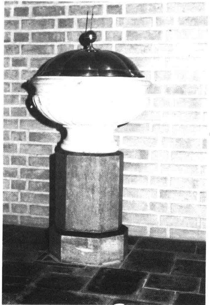
De doopvont van circa 1800 uit de eerste R.K. kerk in Oudenrijn.

De koop van de buitenplaats was wel gesloten maar het zou tot 18 mei 1797 duren voordat de koopakte bij de „voormalige Geregte van den Ouden Rhijn” werd getransporteerd.