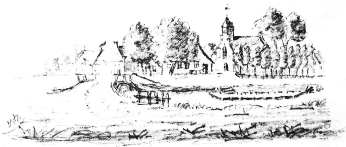
De Meern komende van Utrecht