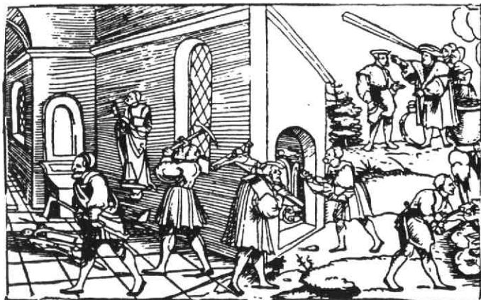
Detail van een houtsnede met een voorstelling van de Beeldenstorm in 1572.

De tegenstellingen tussen katholieken en hervormingsgezinden werden steeds groter en de laatste kregen steeds meer macht in handen. Door religieuze, sociale en politieke factoren was er in de Nederlanden een explosief klimaat gegroeid. Dit ontladde zich toen in 1566, als gevolg van hongersnood, zuidnederlandse textielarbeiders in Hond-schoote kerken gingen plunderen. De gebeurtenissen grepen snel om zich heen en tot in het hoge noorden van de noordelijke Nederlanden was de beeldenstorm een feit.