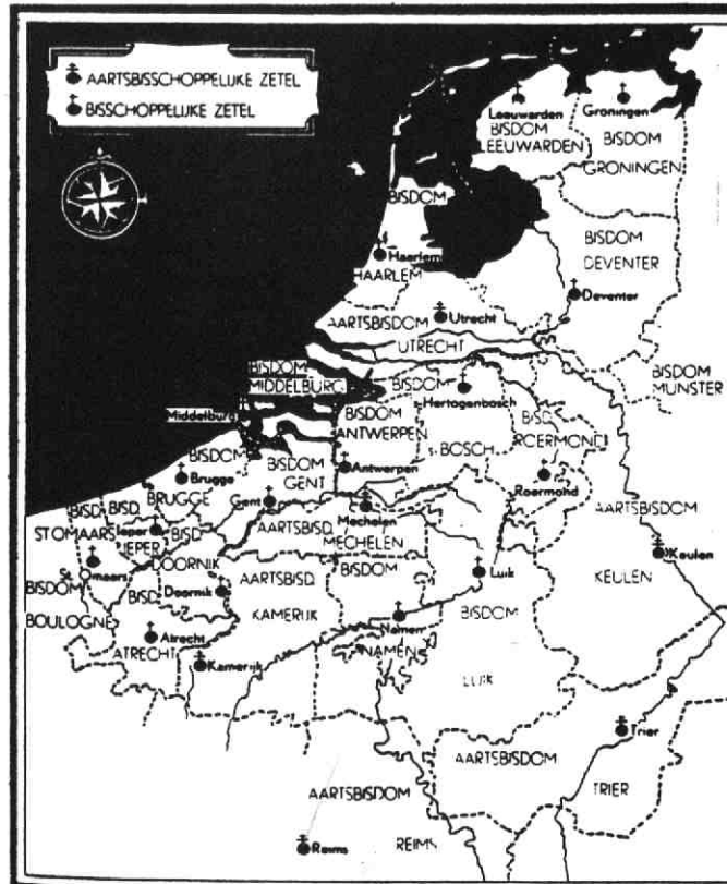
De nieuwe kerkelijke indeling van 1559 die nooit tot uitvoering is gekomen.

De nieuwe indeling van 1559 is nooit tot uitvoering gekomen omdat ze doorkruist werd door de overwinning van de Reformatie. Het enige wat voor Rome overbleef was om de Nederlanden tot missiegebied te verklaren.