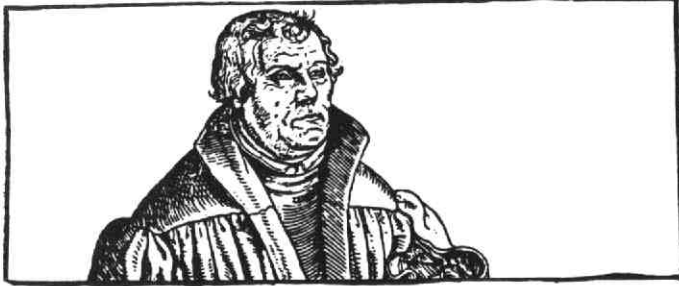
Fragment van een houtsnede met Maarten Luther op 63 jarige leeftijd.

In het begin van de zestiende eeuw werden de Nederlanden geregeerd door Karel V (1500 - 1556) uit het Duitse huis Habsburg. Onder zijn bewind ging men zich verzetten tegen de macht en de praktijken van de R.K. kerk. De Duitse Augustijner pater Maarten Luther (1483 - 1546) fulmineerde tegen de aflaat die Paus Leo X had ingesteld ten behoeve van de bouw van de nieuwe St Pieterskerk in Rome. Een aflaat is een kwijtschelding van tijdelijke straffen bij een berouwvolle biecht. Al spoedig kwam berouw op de achtergrond en werd de aflaat, tegen betaling, een vrijbrief van schuld. Maarten Luther kwam hiertegen in verzet en op 31 oktober 1517 spijkerde hij, volgens het toen academische gebruik, zijn 95 Latijnse stellingen op de deur van de kapel in Wittenberg.