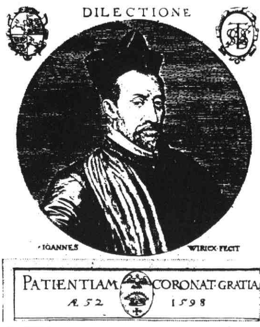
Gravure van Sasbout Vosmeer de Apostolisch Vicaris van de Hollandse Zending.

Elke maatregel die genomen wordt heeft vóór- en tegenstanders, hetgeen ook voor de nieuwe kerkelijke situatie in 1622 heeft gegolden. In de navolgende periode zijn de nodige problemen ontstaan, die hier verder buiten beschouwing worden gelaten.