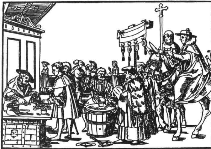
Spotprent over de aflatenhandel waartegen Maarten Luther zich verzette.

In eerste instantie was de invloed van het Lutheranisme zeer gering, maar die werd later, onder andere door het Calvinisme, groter, waardoor de zorg van kerkelijke en wereldlijke machthebbers toenam.