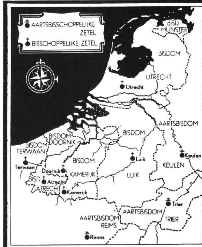
De oude kerkelijke indeling vóór 1559.

gen. Daarnaast werd gedacht aan de oprichting van de suffragaanbisdommen Leeuwarden, Groningen, Deventer, Haarlem, Middelburg, Roermond en 's Hertogenbosch.