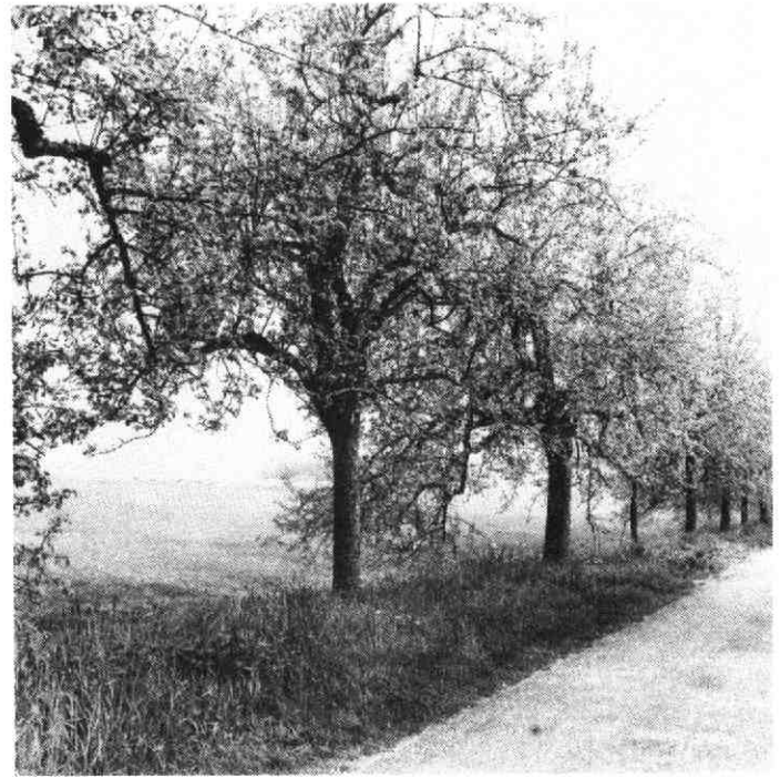
De Enghlaan met bloeiende peregomen, gezien in noordwestelijke richting. mei 1972.

Het is mogelijk, dat de eigenaren van de verschillende versterkte huizen in Vleuten een dergelijke vergunning konden bemachtigen. In ieder geval was het zandpad in 1777 al geruime tijd voor alle verkeer opengesteld, getuige de volgende ordonnantie van de Staten van Utrecht in dat jaar: Alzoo hun edelmogenden voor lange jaaren tot gerief van den passerenden man een voetpad hebben doen maken en zanden, strekkende van Utrecht af tot Harmelen toe, en hetzelfde vervolgens tot een bekwamen rijweg geappropriert nu reets veele jaaren door een iegelijk also gebruikt en bereden wordt , etc. (Vervolg Groot Placaatboek, Dl. 2, Blz. 61).