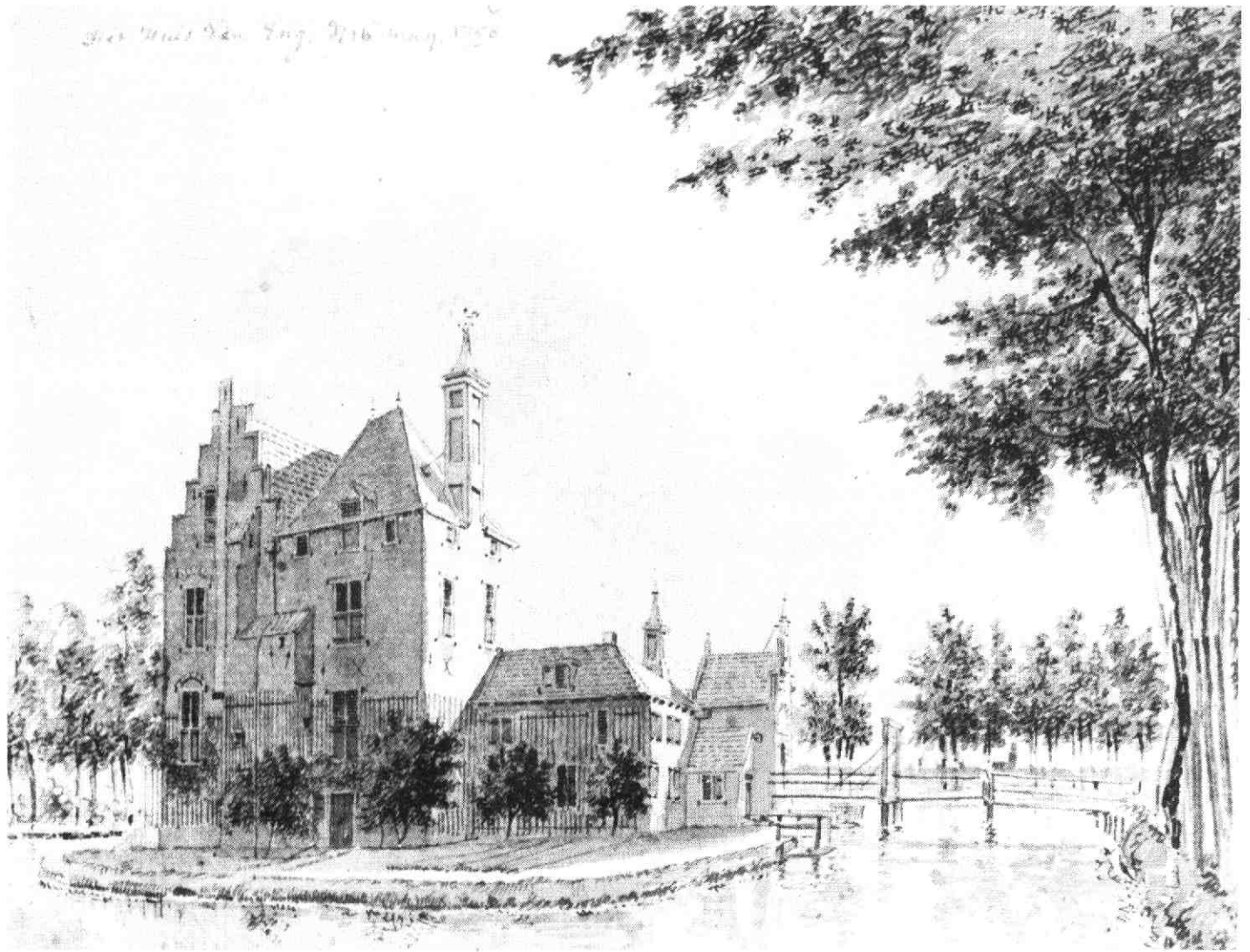
Het Huis den Eng.

Pen en penseel in grijs van J. de Beijer, 1750.