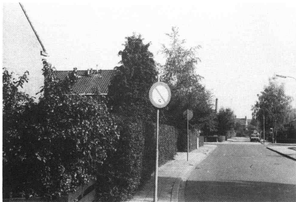
De topgevels van „Plan Hamweg” langs de Den Hamstraat in oostelijke richting in de zomer van 1986. 24 jaar later ziet het nieuwbouwwijkje er heel wat vriendelijker uit.

Het wonen in Vleuten is eigenlijk zo gek nog niet!