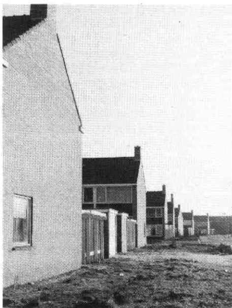
De topgevels van „Plan Hamweg” langs de Den Hamstraat in de zomer van 1962 in oostelijke richting. Ver op de achtergrond de wasserij van Van der Kley.

deze saaie eenvormigheid nog maar het begin van de uitbouw van Vleuten was?