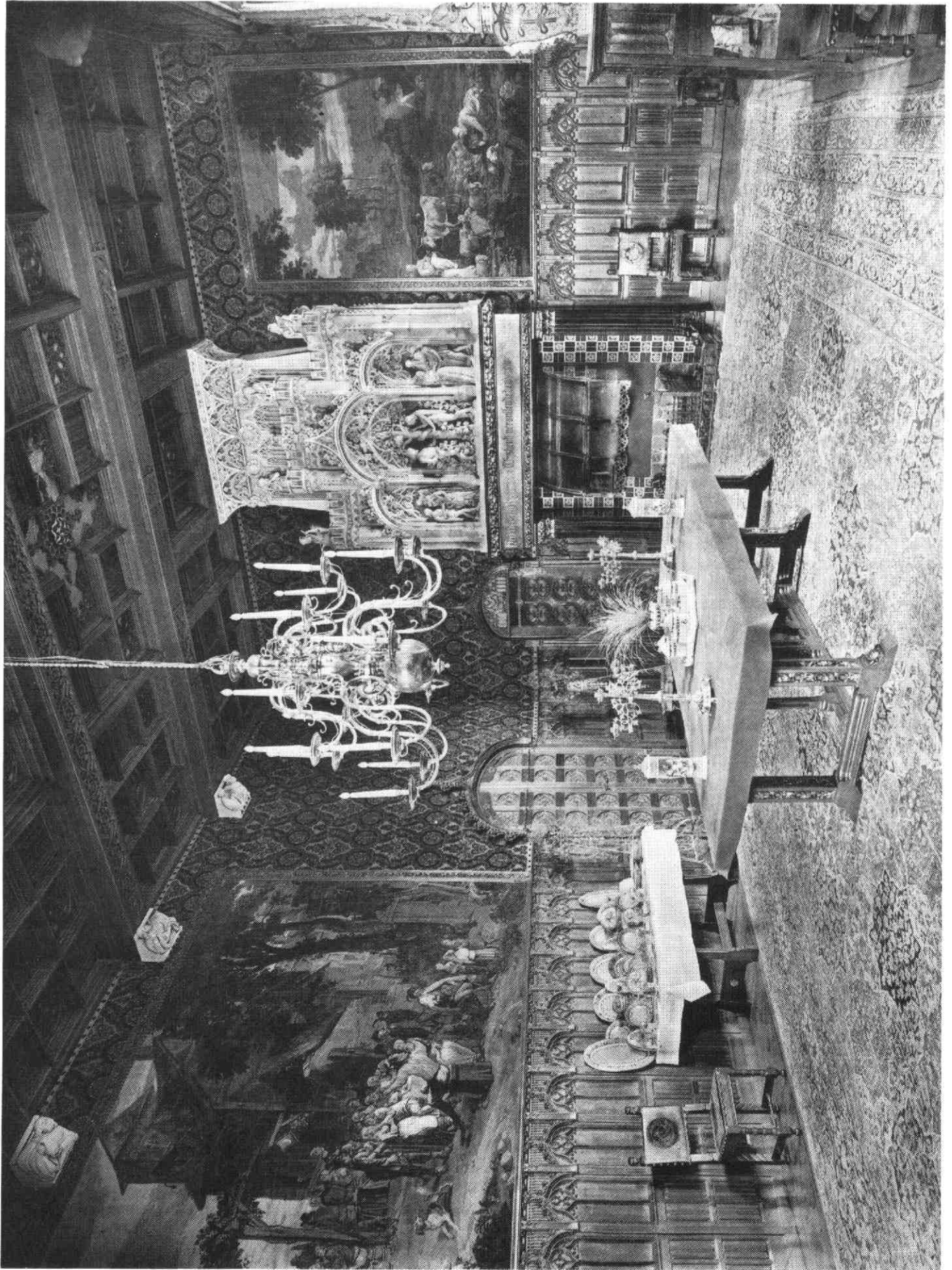
De eetzaal. Deze foto werd vlak na de ingebruikname van het kasteel genomen.