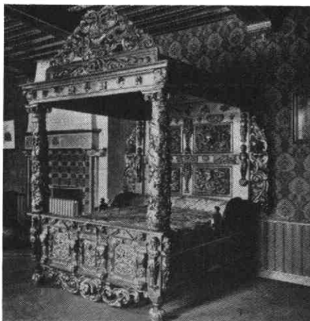
Een fraai beeldhouwd bed.

Het onderhoud van zo'n gebouw moet een gigantische klus zijn en het lijkt een redelijke veronderstelling dat hiermee heel wat mensen in de weer zijn. In werkelijkheid valt dat wel mee. Weliswaar wordt er jaarlijks groot onderhoud gepleegd door specialisten als leidekker, schilder en aannemer, maar men tracht zoveel mogelijk zelf te doen. Zo zet het personeel alles regelmatig in de lak of de