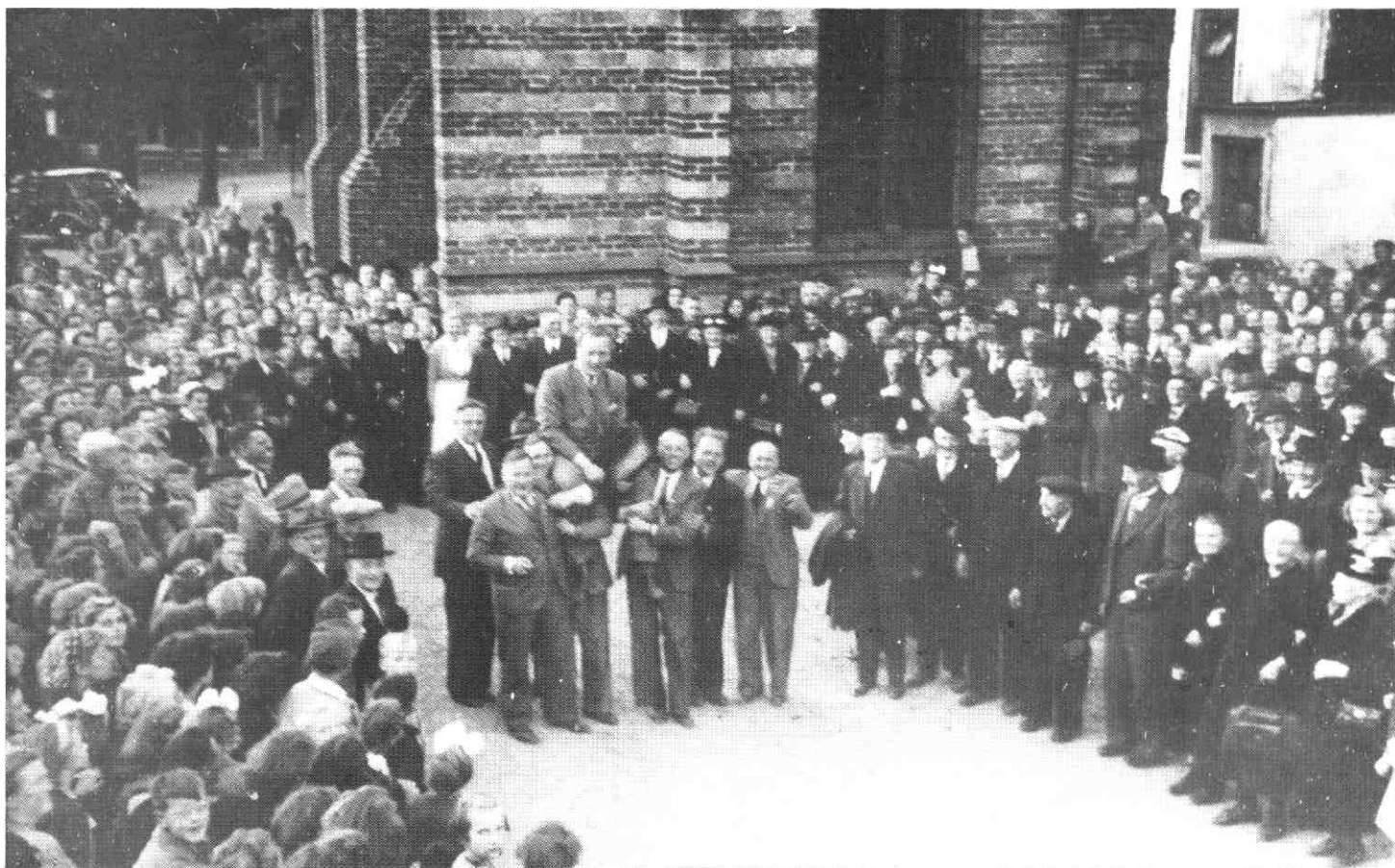
Na een geslaagde tocht van de bejaarden werd de voorzitter (Jaap Sprong) op de schouders genomen.