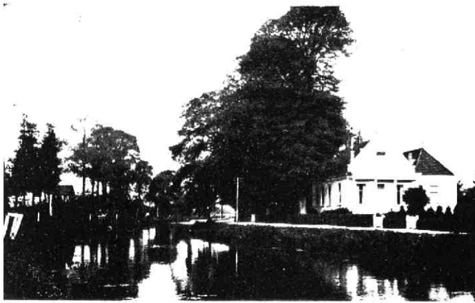
De Meern - Geervliet