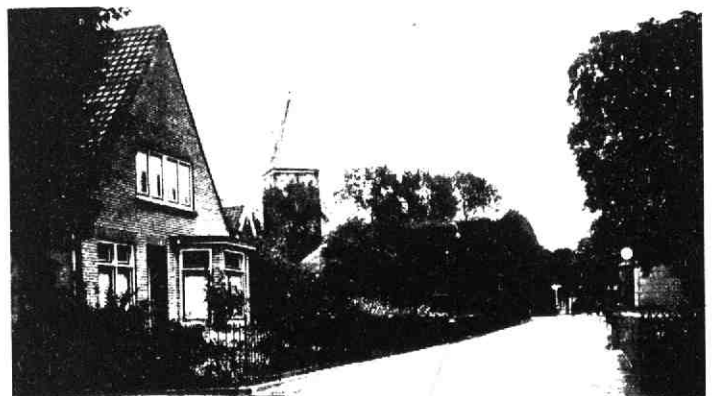
Vleuten - Dorpsstraat N.Z.

Dit landgoed heeft een grijs verleden. In 1275 wordt het reeds genoemd.