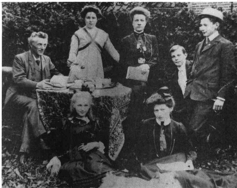
De familie Lubach