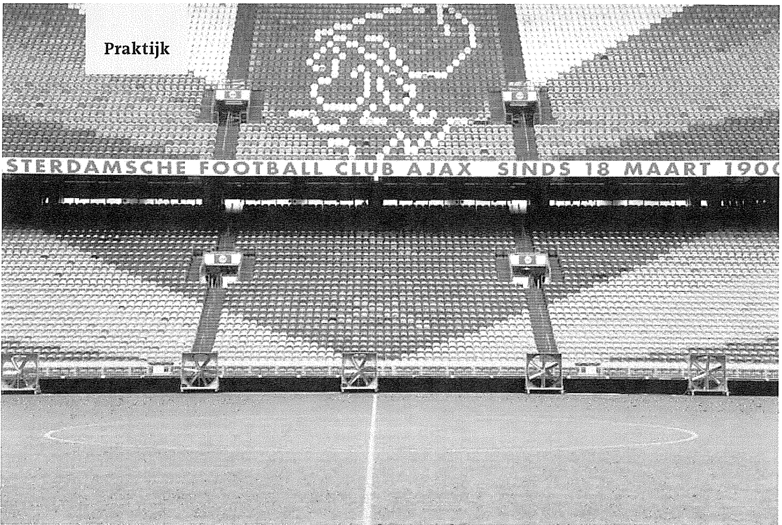
Amsterdam ArenA

de commissarissen het bijzondere vertrouwen van de Vereniging geniet. Als zodanig zijn in het reglement de volgende drie commissarissen aangewezen: Crujff, Olfers en Davids.