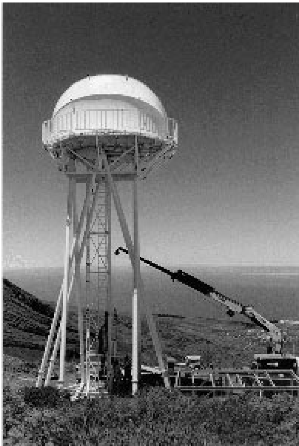
Figuur 3: De Dutch Open Telescope, gezien vanaf de Zweedse zonnetoeren op de Roque de los Muchachos (La Palma). Je kijkt hier langs de DOT van 2300 meter neer op de zee. De foto is gemaakt op 28 juli nadat de telescoop en de wegklapbare koepel bovenop de vijftien meter hoge toren waren gehesen. Het frame waarin de telescoop werd vervoerd staat er nog naast. Telescoop, koepel en platform wegen zo’n dertig ton. Hammerschlag’s ontwerp levert uitzonderlijke stijfheid. Dit is nodig omdat de seeing het best is bij flinke wind; juist dan moet de volgnauwkeurigheid binnen de 0.01 boogseconde blijven. De telescoop is gebouwd door de vakgroep Sterrekunde, de facultaire instrumentatiegroep (IGF) en de centrale werkplaats van de TU Delft met steun van de Stichting Technische Wetenschappen.

De SOHO missie heeft dankzij zuinige manoeuvres nabij de maan nog voor dertig jaar brandstof aan boord. Ook de Japanse Yohkoh satelliet die dagelijks Röntgenbeelden van de zon verzamelt is een lang leven beschoren. Daarnaast zijn er andere ruimteprojecten op komst (TRACE, Solar-B, Solar Lite) waarin Utrechters zijn betrokken. Werk aan de winkel!